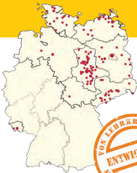
Zertifizierte Schulen in Deutschland